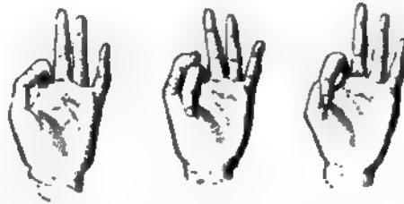
Сорокъ. Пятьдесятъ. Шестьдесятъ. Фиг. 6.

большой и указательный пальцы, соприкасающиеся своими концами (т.-е., образующие нечто въ родѣ кольца), обозначаютъ . . . . 30.